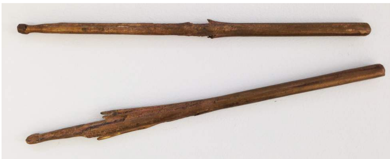
Paires de baguettes, 08-04-2006, Mocvara, Zagreb, Croatie