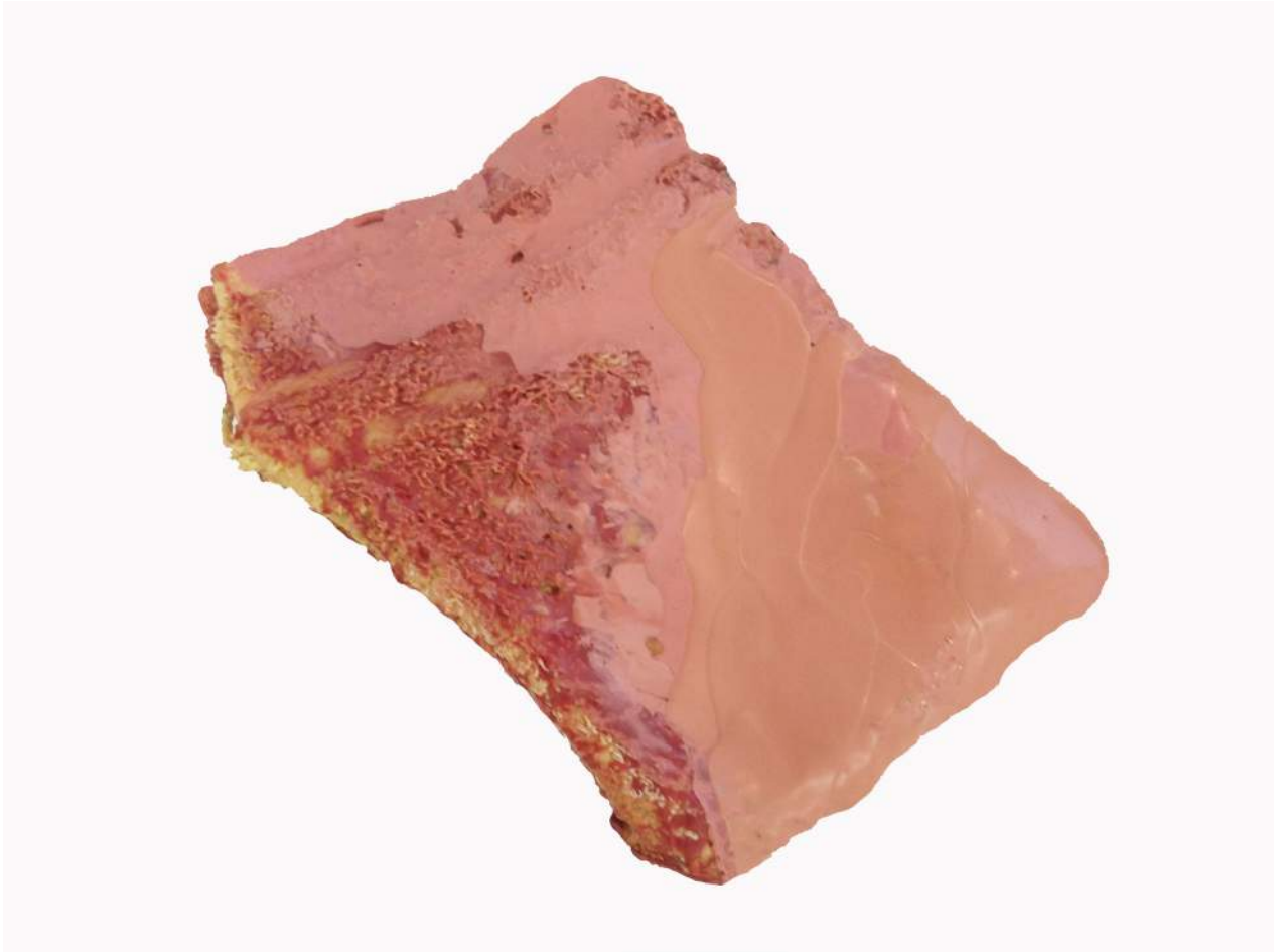
Gant à débarbouiller la peinture Cire et pigments sur tissu éponge Pièce unique 22 x 16 x 6 cm, signée et datée 1993